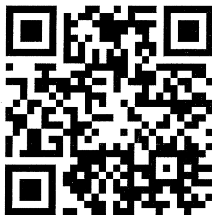
圖1、資源循環署網站 QR Code 連結

本署於113年5月8日預告回收標誌公告之修正草案（草案內容可參考資源循環署網站，網址 https://www.reca.gov.tw/bulletin ，或掃描圖1之 QR Code 連結參閱）。會議中將針對塑膠襯墊及泡殼之回收標誌標示責任業者範圍、標示內容、標示時點及相關排除標示之對象等規定完整說明。