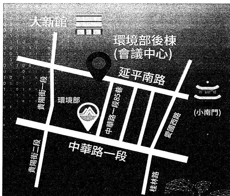
圖3、環境部後棟會議中心位置圖